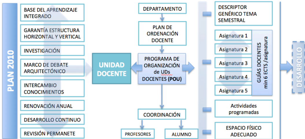
Cuadro 5: estructura organizativa del Plan 2010