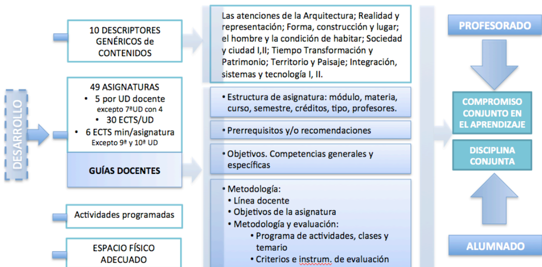
Cuadro 6: Desarrollo metodológico del Plan 2010.