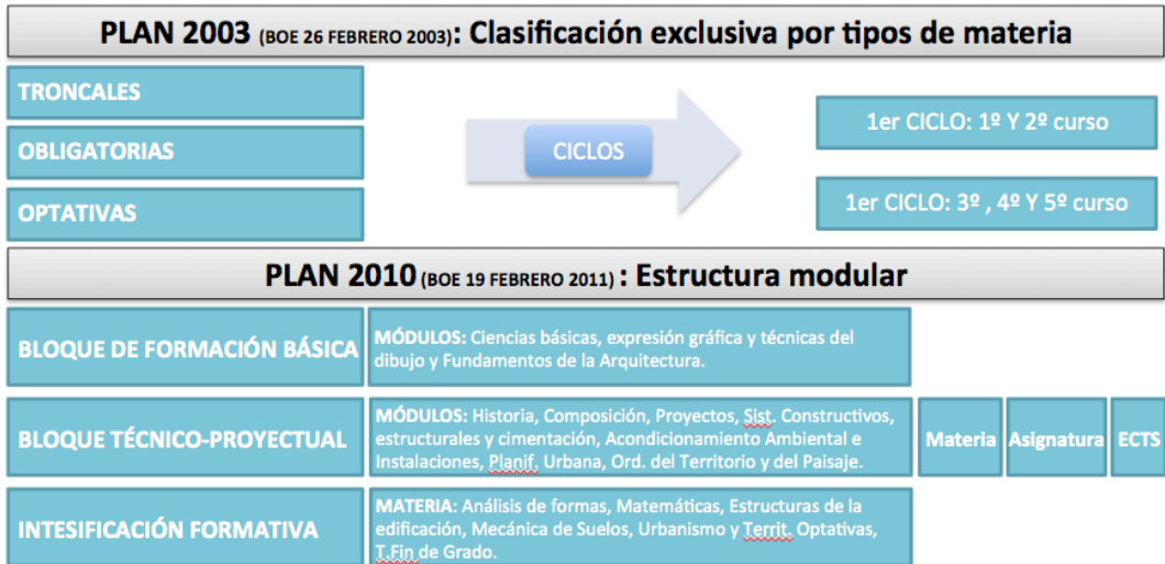
Cuadro 3: comparativa de la estructura organizativa de los Planes: clasificación por materias